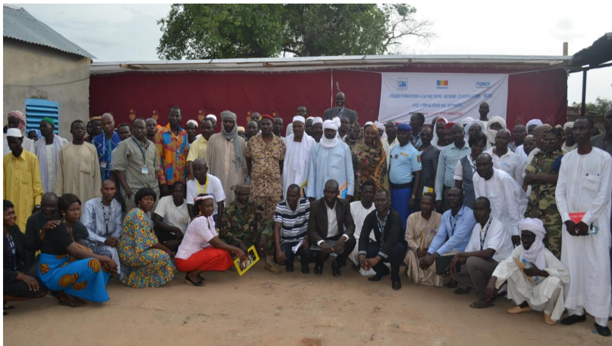
Les Officiels et les participants au sortir de l'atelier

Il s'est tenu ce jour 12 juillet dans les locaux de notre bureau de Haraze l'atelier d'éducation à la Paix et la Cohabitation pacifique. Un atelier qui s'inscrit dans la dynamique des activités visant la coexistence pacifique entre les réfugiés et les populations hôtes de nos zones de responsabilité.