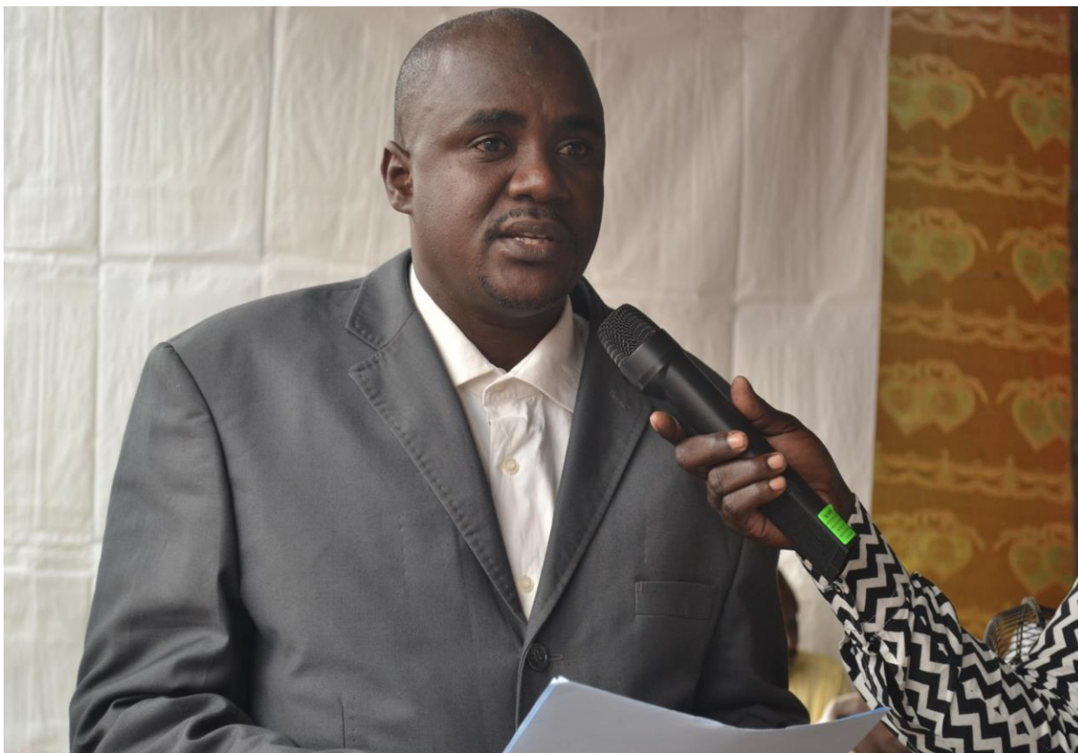
Le Chef de bureau faisant son allocution