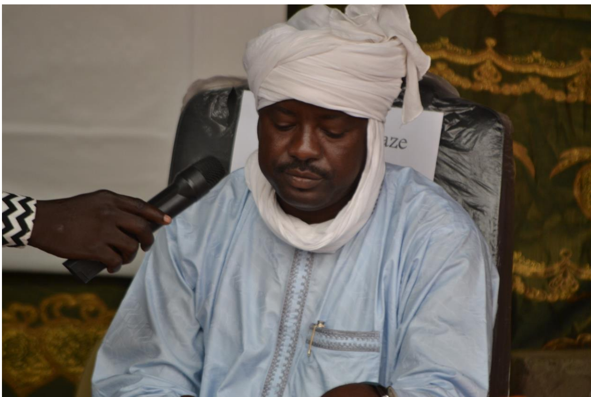
Le Préfet du département de Haraze Ismail AHMED ouvrant les travaux de l'atelier