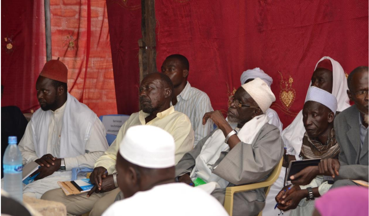
Les autorités traditionnelles et coutumiers ont répondu présents aux assises