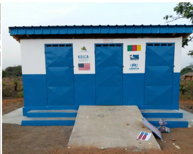
Bloc de latrine et douches