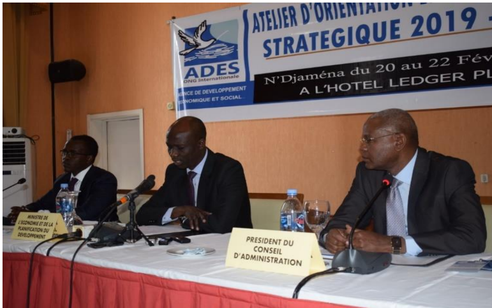
Le Ministre de l'économie et de la planification du développement au (centre) ouvrant les travaux de l'atelier

L'Agence de développement économique et social (ADES) a organisé du 20 au 22 février 2019 à N'Djamena un atelier d'orientation et d'élaboration de son plan stratégique 2019-2023. L'ouverture des travaux est présidée par le Ministre de l'Economie et de la Planification du développement, Issa Doubragne.