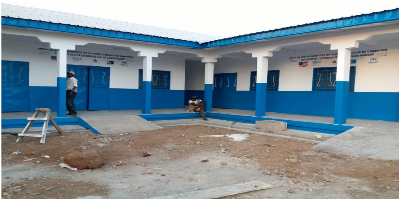
Vue partielle du bâtiment principal du Centre de santé

C'est un bâtiment comprenant des salles de consultations, des salles d'hospitalisation, une unité de nutrition, un hangar servant d'espace d'accueil, un bloc de latrines et douches. Financé par le Haut-Commissariat des nations unies pour les réfugiés et réalisé par notre organisation, ce centre de santé profitera aux réfugiés centrafricains de GADO et la communauté locale.