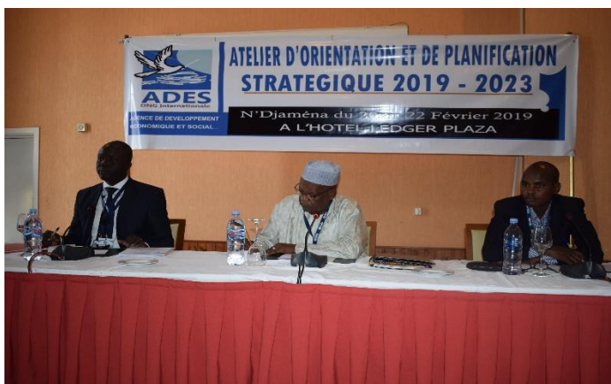
Quelques images de l'atelier de planification stratégique