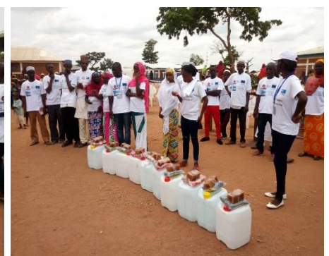
La célébration en image