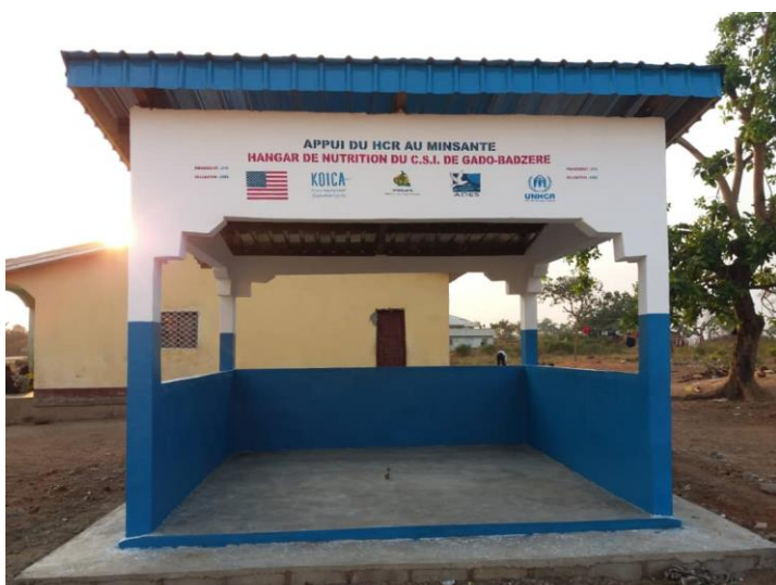
Unité de nutrition du centre de santé