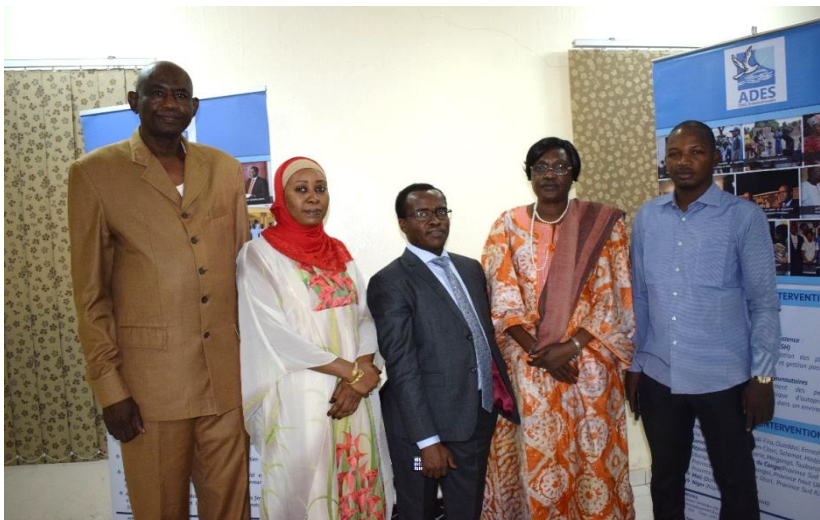
Les membres de la Ligue et le Directeur Général au terme de la rencontre

La Ligue a pour mission de lutter contre le cancer dans toute sa dimension. Elle est composée de deux organes notamment la direction exécutive et le comité scientifique.